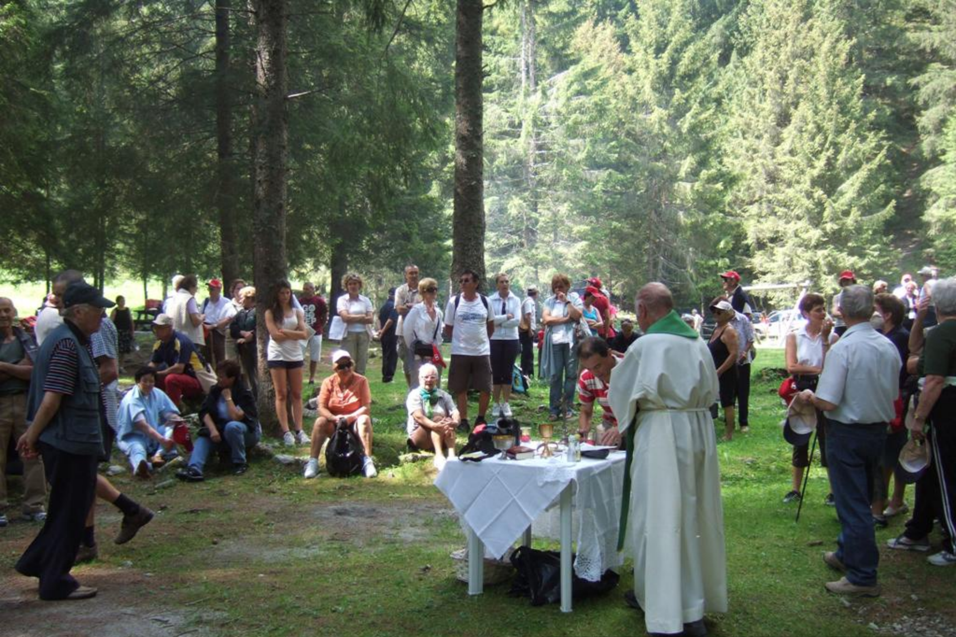
La Santa Messa